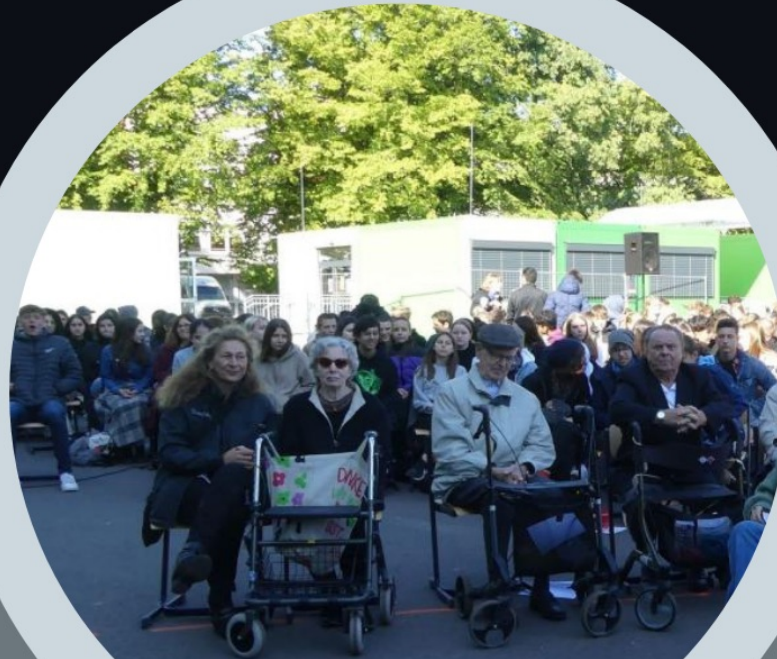
Gedenkveranstaltung am Gymnasium Langenhagen 2022